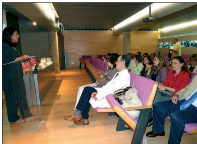
Un momento de la sesión, celebrada en el salón de actos de la Clínica Rotger.