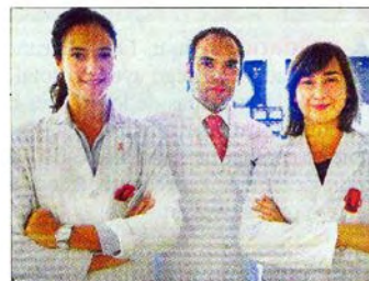
Solidaridad e información. Lazo humano contra el cáncer de mama, paraguas y alumbrado rosa y profesionales de la Clínica Rotger (sobre estas líneas) que informan sobre la enfermedad.