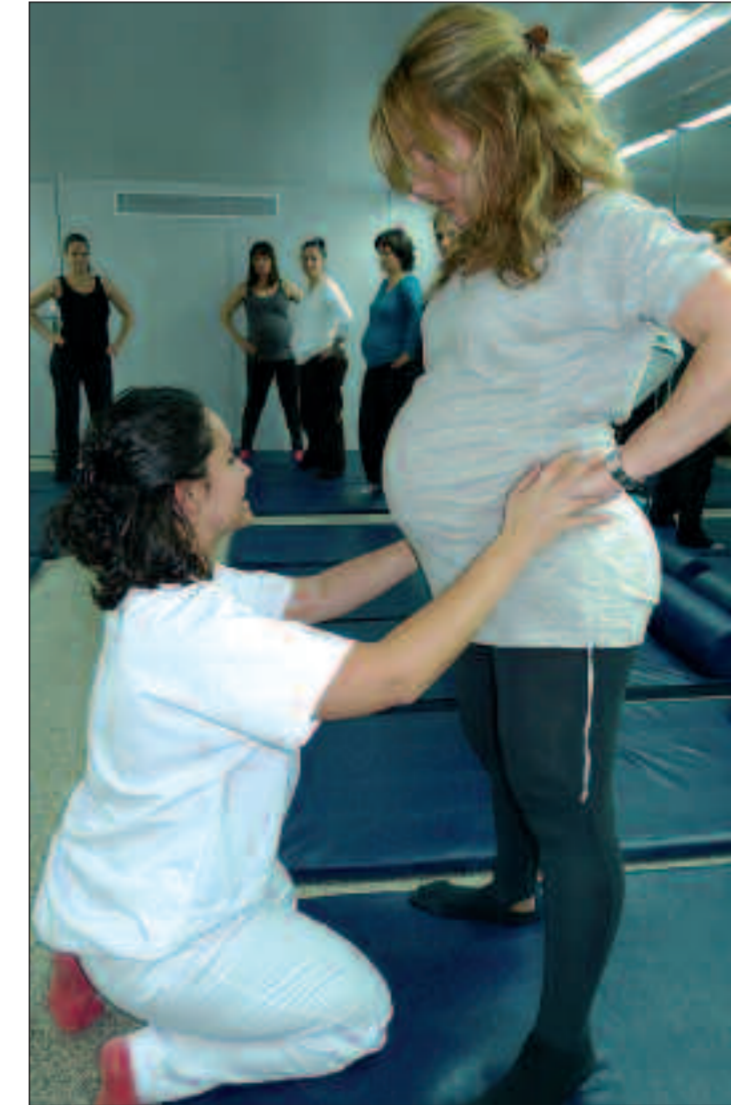
Sobre estas líneas, tres imágenes del curso de Educación Maternal.