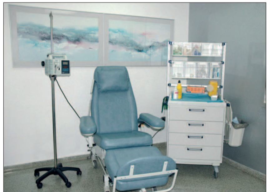
Box de quimioterapia de la Clínica Rotger.