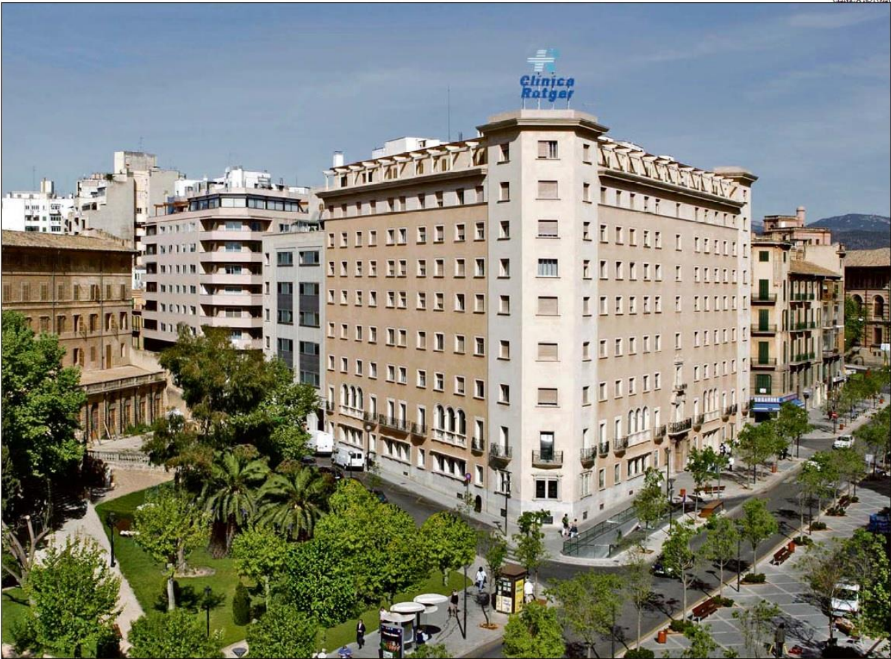
El servicio de cirugía plástica de la Clínica Rotger cuenta con todas las garantías de un entorno hospitalario.