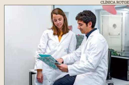
Especialistas formados en la prevención y tratamiento del cáncer de cutáneo.

En el nuevo entorno de consultas externas de la Clínica Rotger, el equipo de Dermathos atiende toda la patología dermatológica de pacientes adultos y pediátricos. Sus especialistas están en continua formación para aplicar los tratamientos más novedosos en detección precoz, prevención y tratamiento del cáncer de piel, así como las más avanzadas técnicas de dermatología estética y el cuidado de la piel.