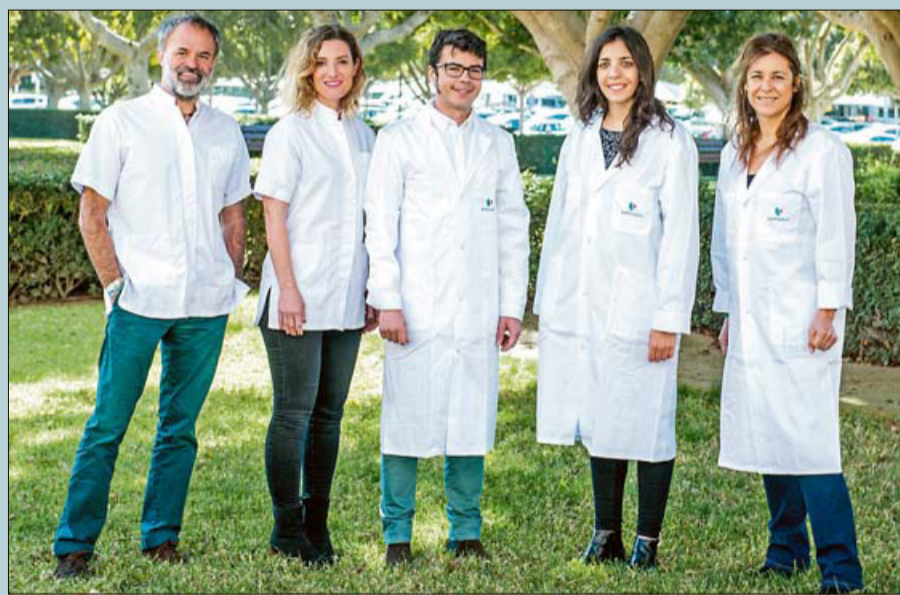
Equipo de la Unidad del Adolescente de Hospital Quirónsalud Palmaplanas.