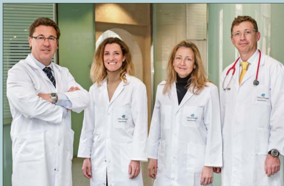
Equipo de la Unidad del Adolescente de Clínica Rotger.

Los cambios físicos y psicosociales que se producen en la adolescencia son tan importantes que justifican la conveniencia de llevar un control periódico y continuado de la salud con un médico